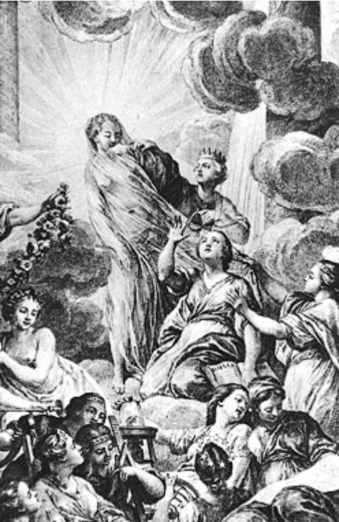
Detalj fra omslaget til Encyclopédie (1772), tegnet av Charles-Nicolas Cochin og gravert av Bonaventure-Louis Prévost. Bildet er fylt med symbolisme: Figuren i midten er sannheten, omgitt av et skinnende lys (det sentrale symbolet i opplysningstida). Figurene til høyre er fornuft og filosofi, som river ned sløret foran sannheten.