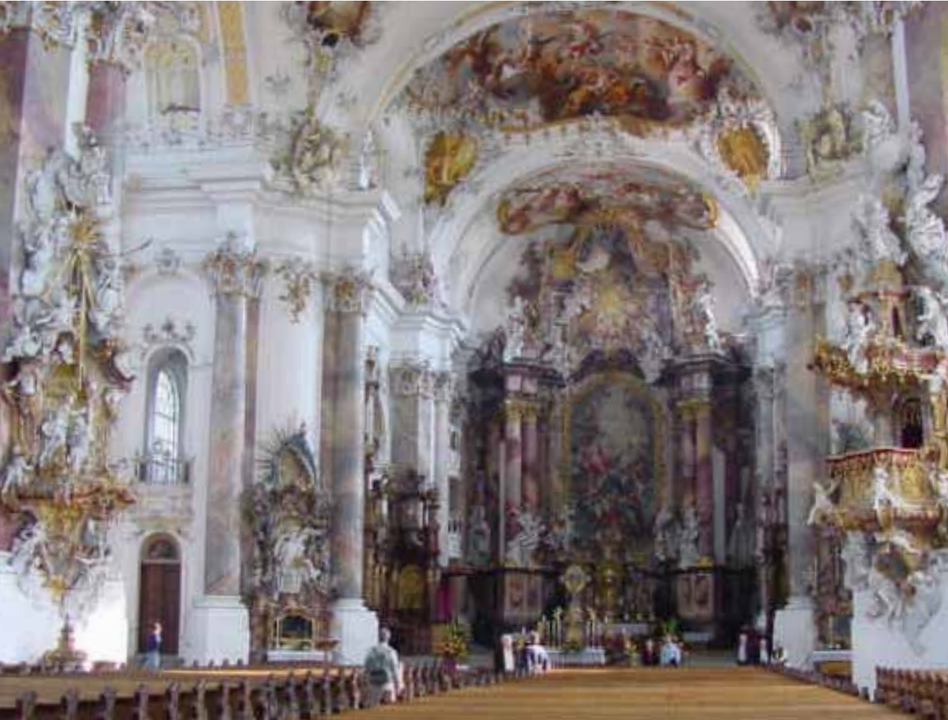
Kirke i rokokkostil, Ottobeuren i Böhmen