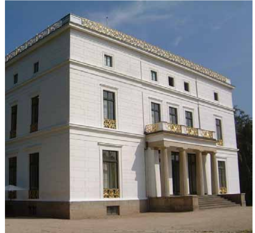
Klassisistisk arkitektur: Jenisch Haus i Hamburg

Dikteunst blir regnet for handverk. Det er klare regler for hvordan en skal skrive i de ulike sjangrene. Det klassiske dramaet følger regelen om sammenfall i tid, sted og handling.