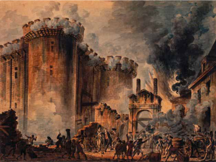
Stormen på Bastillen 14. juli 1789 innledet den franske revolusjonen