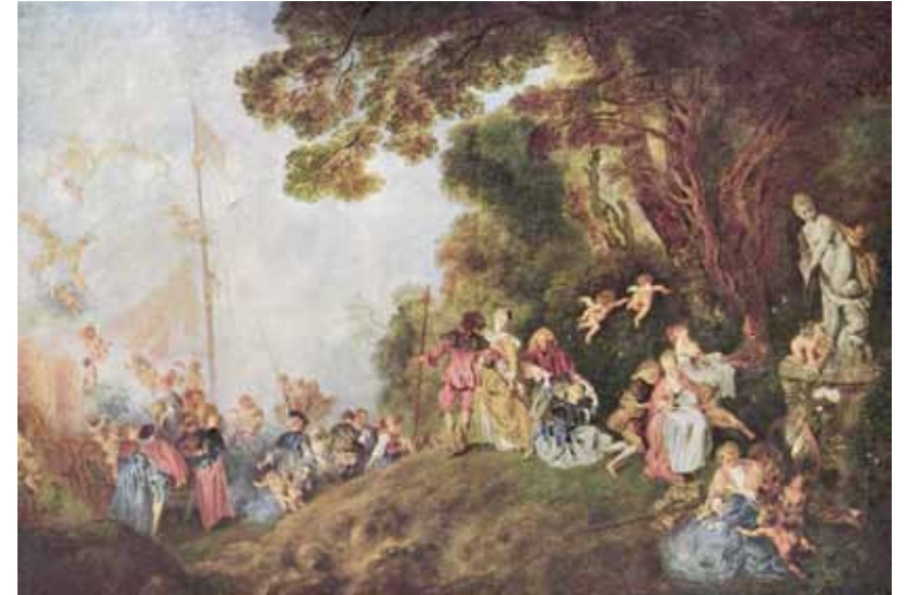
Maleri av Jean-Antoine Watteau (1721)