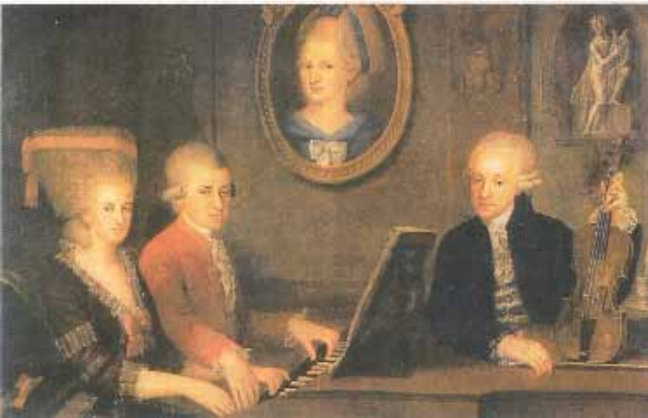
Mozart spiller kammermusikk sammen med søstera og faren.