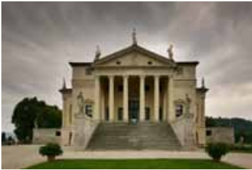
Palladios Villa Rotonda i Italia