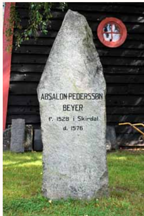
Minnestein ved Vangen kirke i Aurland

☞ Absalon Pedersson Beyer hadde en sentral plass i dette miljøet fordi han var en representant for 1500-tallets humanistiske dannelsesideal. Dessuten var han med på å starte et skolemiljø som seinere fikk mye å si for litteratur og åndsliv her i landet.