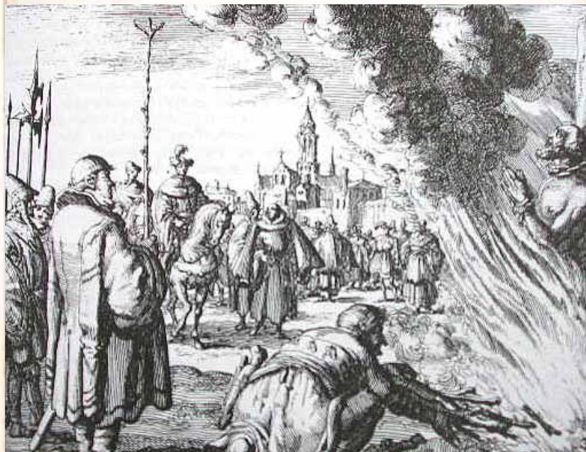
Anne Pedersdotter, Absalons kone, ble dømt som heks og brent på bålet. Saken mot henne er en av de best dokumenterte hekseprosessene i Norge

☞ Absalon Pedersson Beyer var en høyt aktet mann i Bergen, men han fikk også sine fiender fordi han refset tøylesløs og umoralsk livsførsel.