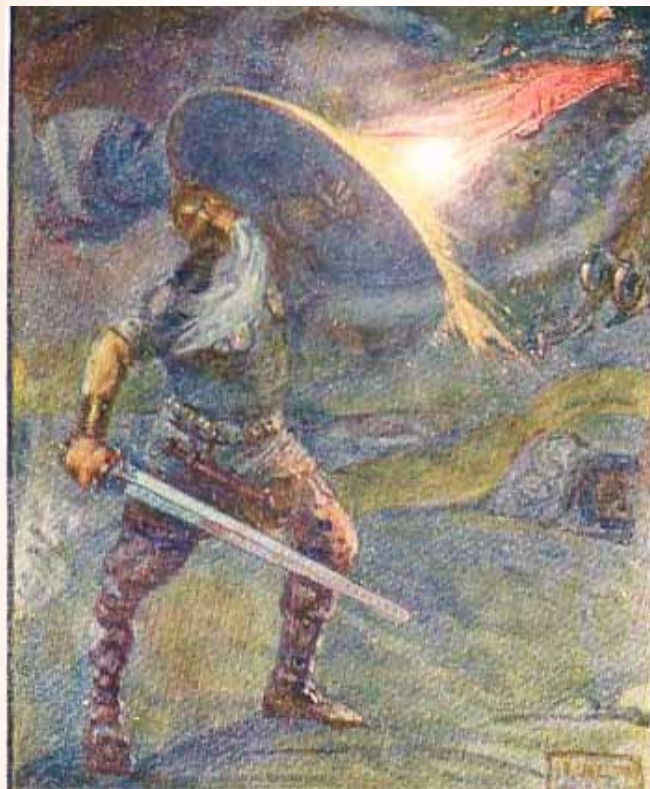
Beowulf i kamp med draken. Til høgre gravhaugen i Skalunda i Götaland der Beowulf skal vere hauglagd.

del av kvadet skildrar korleis han dreg ut saman med mennene sine for å drepe ein drake som legg landet hans i øyde. Men det er berre éin av mennene som torer møte draken saman med han. Beowulf