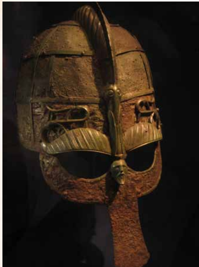
Prakthjelm i jarn og bronse funnen i ei svensk båtgrav frå den tida då Beowulf levde.

☞ Helten Beowulf er prega av ei sterk lagnadstru. Han er overtydd om at det er lagnaden som avgjer når han skal døy. Denne lagnadstrua er djupt forankra i germansk krigartradisjon. Vi finn den same trua også i dei norrøne heltedikta og i islendingesogene.