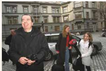
Jan Kjærstad fekk Nordisk råds litteraturpris i 2001. Her er han på veg til pressekonferanse saman med døtrene.

☞ Kjærstad er på mange måtar ein forfatter med eit litterært program. I tillegg til å skrive romanar og noveller har han skrive ulike essay og artiklar om litteratur. I Menneskets matrise (1989), Menneskets felt (1997) og Menneskets nett (2004)