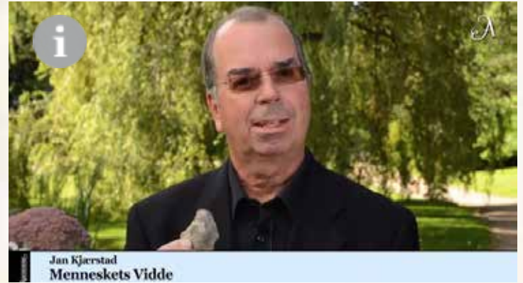
Jan Kjærstad om romanen «Menneskets vidde»

☛ Eit grunnleggjande spørsmål i heile forfattarskapen til Kjærstad er spørsmålet om kva det vil seie å vere menneske. Kjærstad bruker språket og forma på forteljinga til å formidle innsikt og gi moglege svar på dette spørsmålet. I botnen ligg ein tanke om at forteljingar kan skape identitet. Forteljingar kan skape meining og samanheng i eit liv som elles kan verke fragmentert og styrt av ulike krefter i eit globalt medie- og informasjonssamfunn.