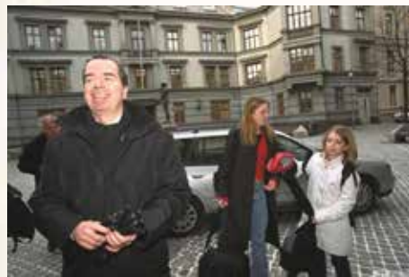
Jan Kjærstad fikk Nordisk råds litteraturpris i 2001. Her er han på vei til pressekonferanse sammen med sine døtre.

☛ Kjærstad er på mange måter en forfatter med et litterært program. I tillegg til å skrive romaner og noveller har han skrevet ulike essays og artikler om litteratur. I Menneskets matrise (1989), Menneskets felt (1997) og Menneskets nett (2004)