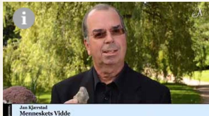
Jan Kjærstad om romanen «Menneskets vidde»

☛ Et grunnleggende spørsmål i hele Kjærstads forfatterskap er spørsmålet om hva det vil si å være menneske. Kjærstad bruker fortellingens språk og form til å formidle innsikt og gi mulige svar på dette spørsmålet. I bunnen ligger en tanke om at fortellinger kan skape identitet. Fortellinger kan skape mening og sammenheng i et liv som ellers kan virke fragmentert og styrt av ulike krefter i et globalt medie- og informasjonssamfunn.