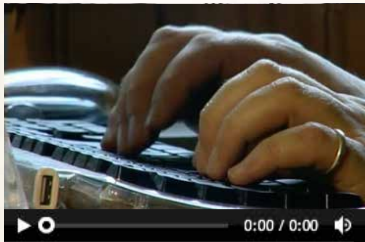
Følg Jon Fosse gjennom skriveprosessen fram mot eit nytt skodespel

med Ludvig Holbergs. Fosses dramatikkk blir av mange omtalt som eit paradigmeskifte innan norsk teater- og skodespeltradisjon. Stykka tvingar oss til å tenkje på skodespel og teater på ein grunnleggjande ny måte. Fosse blir gjerne omtalt som «ein meiser med pausar», og det er nettopp fråværet av dialogar og replikkar som gjer stykka hans så unike og nyskapande.