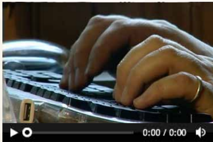
Følg Jon Fosse gjennom skriveprosessen fram mot et nytt skuespill

– en dramatisk raptus på lik linje med Ludvig Holbergs. Fosses dramatikkk blir av mange omtalt som et paradigmeskifte innen norsk teater- og skuespilltradisjon. Stykkene tvinger oss til å tenke på skuespill og teater på en grunnleggende ny måte. Fosse blir gjerne kalt «pausenes mester», og det er nettopp fraværet av dialoger og replikker som gjør stykkene hans så unike og nyskapende.