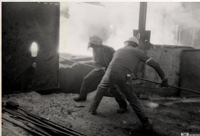
Arbeidarar ved Sauda Smelteverk.

den latinamerikanske magiske realismen. Fløgstad blandar fantasi og røyndom og har fleire svært utfordrande eksperiment både med kronologi og forteljarperspektiv. Ofte nyttar ein nemninga sosialmodernisme om skrivestilen hans. Dalen Portland er eit døme på ein slik sosialmodernistisk roman.