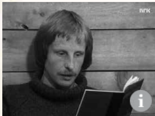
Sjå ein ung Kjartan Fløgstad snakke om lyrikken sin på NRK Skole

☞ Dei to første diktsamlingane til Kjartan Fløgstad er modernistiske. Dei kan plasserast i ein symbolistisk tradisjon.