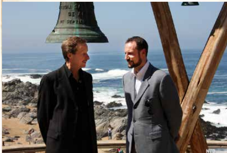
Da kronprins Haakon besøkte Chile i 2008, la han veien om Isla Negra der den berømte forfatteren Pablo Neruda hadde holdt til. Kjartan Fløgstad til venstre.

☞ Det tredje perspektivet som er tydelig til stede i både skjønnlitteraturen og sakprosaproduksjonen, er interessen for Latin-Amerika og kultur fra den spansktalende delen av verden. Fløgstad har gjendiktet lyrikere fra Cuba, spanske barokkdiktere og chileneren Pablo Neruda . Han har skrevet reiseskildringer fra, og skrevet om norske emigranter til, Latin-Amerika, og han har på ulike måter latt seg inspirere av den spanskspråklige litteraturen og kulturen.