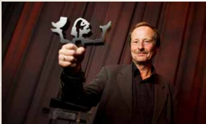
Kjartan Fløgstad med Brageprisen i 2008.