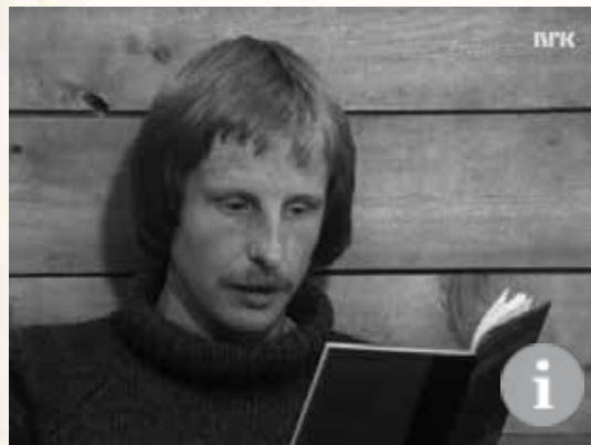
Se en ung Kjartan Fløgstad snakke om lyrikken sin på NRK Skole

De to første diktsamlingene til Kjartan Fløgstad er modernistiske. De kan plasseres i en symbolistisk tradisjon. Mange av