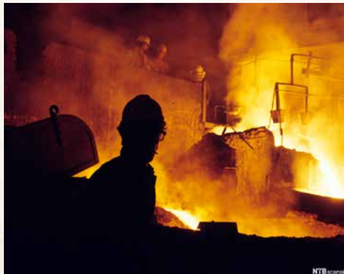
Fra Sauda Smelteverk.

også en mentalitetshistorisk fortelling. Hva skjer med enkeltindividet når et jordbruks- og sjølbergingssamfunn skiftes ut med et kapitalistisk industrisamfunn, et mediesamfunn, et velferds- og forbrukersamfunn? Hvordan takler den enkelte at samfunnets verdier er i endring? Fløgstad går tett inn på karakterene sine for å formidle hvordan samfunnsendringene setter sine spor.