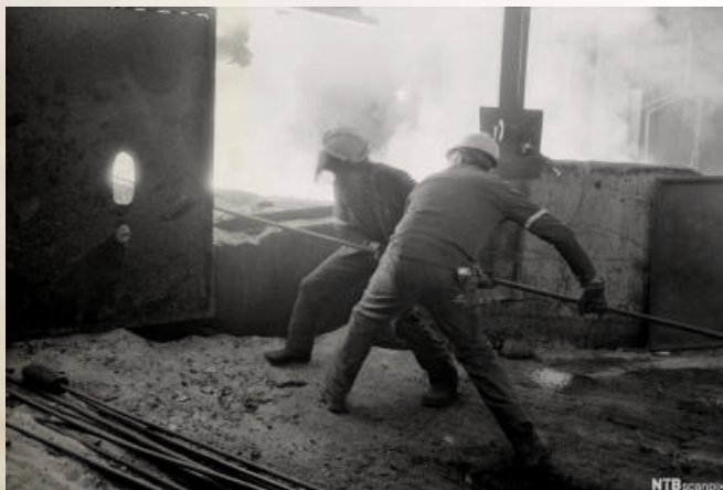
Arbeidere ved Sauda Smelteverk.

den latinamerikanske magiske realismen. Fløgstad blander fantasi og virkelighet og har flere svært utfordrende eksperimenter både med kronologi og fortellerperspektiv. Ofte benytter man betegnelsen sosialmodernisme om skrivestilen hans. Dalen Portland er et eksempel på en slik sosialmodernistisk roman.