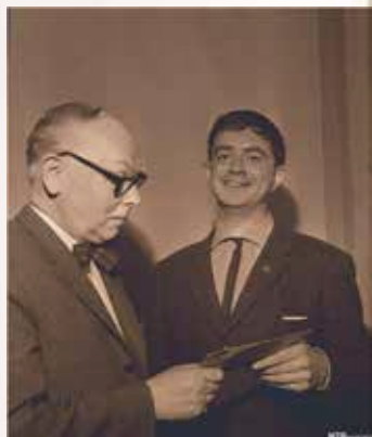
Jan Erik Vold mottok Tarjei Vesaas' debutantpris i 1965.

☛ I 1966 kom diktsamlinga HEKT . Mange av dikta har eit konkret og kvar-dagsleg motiv, dei er knappe, språket er