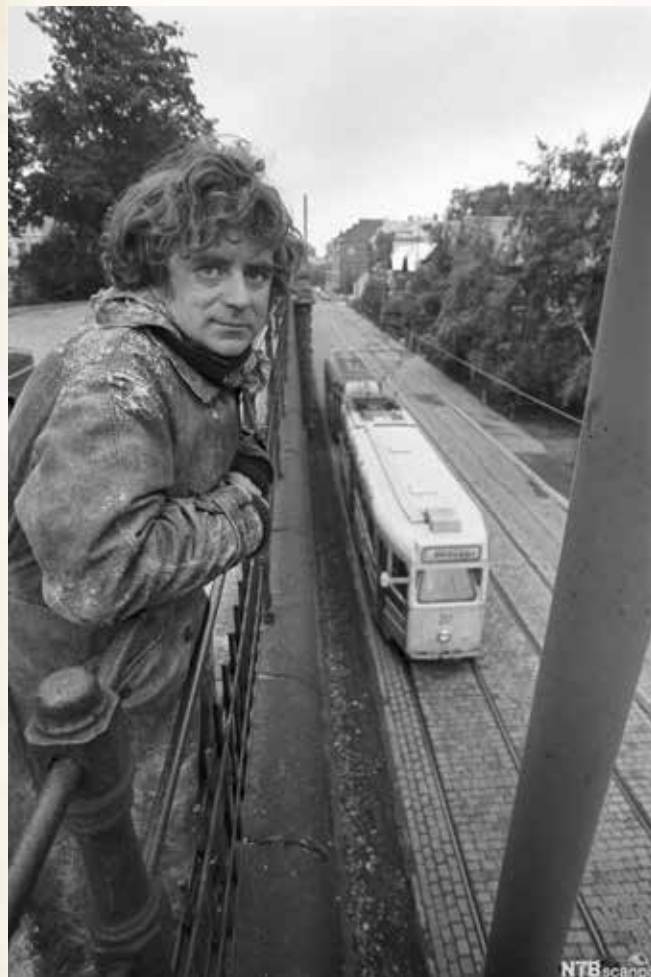
Diktaren Jan Erik Vold og Briskebytrikken i 1975.

Gå ut og se på trikkeskinnene, de binder ikke byen fast, de ligger nedfelt i gaten med brostein solidarisk på begge sider, gå ut.