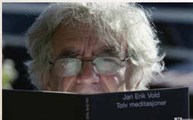
Jan Erik Vold med diktsamlinga «Tolv meditasjoner».

☛ På 80-talet syner Vold seg som ein meir «moden» forfattar, oppteken av sentrallyriske emne som kjærleik, det for-gjengelege, sorg og sagn. Sorgen. Sangen. Veien (1987) inneheld også politiske dikt. Vold er kritisk til pengemakt, maktper-sonar og autoritære regime. I Elg (1989),