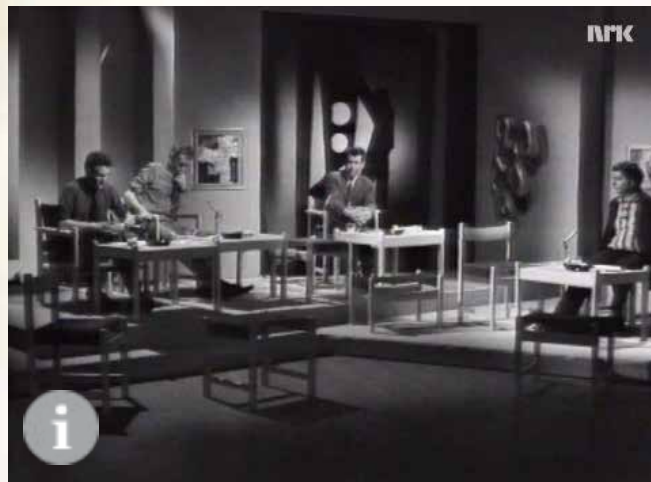
Profil -forfattarane i tv-studio. Du kan lære meir om Jan Erik Vold og denne tida på NRK Skole

☛ Felles for Vold og dei andre lyrikarane i Profil -krinsen var opposisjonen deira mot den tradisjonelle etterkrigsmoder- nismen. Dei meinte han var for innover- vend og alvorleg, og tyngd av komplekse symbol og metaforar. Lyrikk skal ikkje