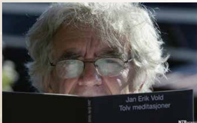
Jan Erik Vold med diktsamlingen «Tolv meditasjoner».

☛ På 80-tallet framstår Vold som en mer «moden» forfatter, opptatt av sentrallyriske emner som kjærlighet, forgjengelighet, sorg og savn. Sorgen. Sangen. Veien (1987) inneholder også politiske dikt. Vold er kritisk til pengemakt, maktpersoner og autoritære regimer. I Elg