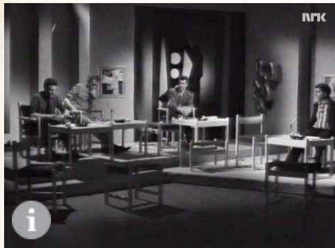
Profil -forfatterne i tv-studio. Du kan lære mer om Jan Erik Vold og denne tida på NRK Skole.

☞ Felles for Vold og de andre lyrikerne i Profil -kretsen var deres opposisjon mot den tradisjonelle etterkrigsmodernismen. De mente den var for innadvent og alvorlig, og tynget av komplekse symboler