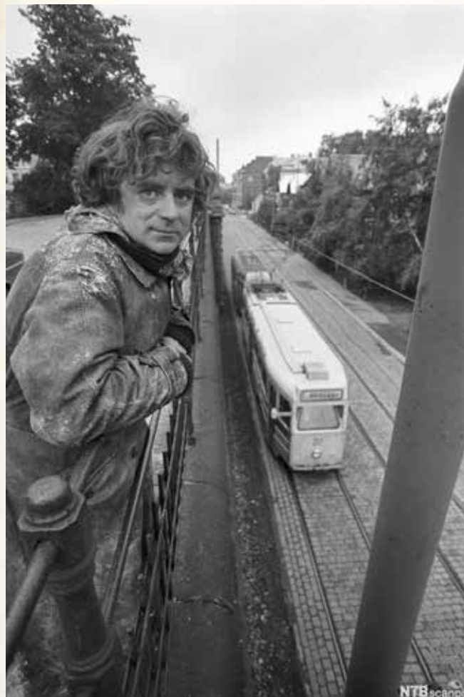
Dikteren Jan Erik Vold og Briskebytrikken i 1975.

Gå ut og se på trikkeskinnene, de binder ikke byen fast, de ligger nedfelt i gaten med brostein solidarisk på begge sider, gå ut.