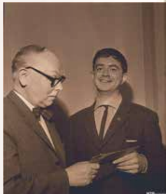
Jan Erik Vold mottar Tarjei Vesaas' debutantpris i 1965.

☛ I 1966 kom diktsamlingen HEKT . Mange av diktene har et konkret og hverdagslig motiv, de er knappe, språket er