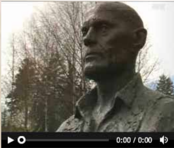
Haldis Moren Vesaas fortel om mannen sin

☞ Vesaas gav ut seks diktsamlingar, som alle er modernistiske i form og uttrykk. Gjennomgangstemaet i dikta hans er angst, vondskap og destruktive krefter. Symbolbruken er rik, og språket er knapt og fortetta, akkurat som i prosadiktinga.