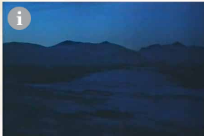
Opningsscena i filmen «Is-slottet»

«Den dype meningen» med Is-slottet er for skøyr liksom til at eg kan leggje ut om det, eg berre øydelegg det. Du som er jente forstår kanskje betre enn eg jamvel. Synest ei bok skal vera hemmeleg når ho er god.