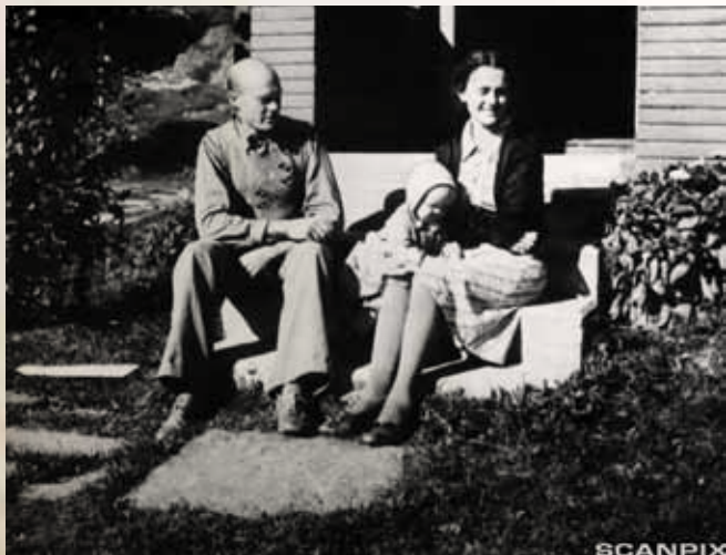
Midtbø, Vinje i Telemark, 1940. På trappa på garden sit forfattarekteparet Halldis Moren Vesaas og Tarjei Vesaas.

☛ Tarjei Vesaas skreiv både romanar, noveller, skodespel og dikt. Han debuterte i 1923 med romanen Menneskebonn . Både i denne boka og i dei neste romanane i 1920- og 1930-åra skreiv han om mennesket som er bunde til tunge eksistensielle kår.