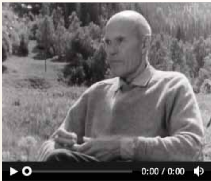
Ungdomstid og krig. Intervju med Tarjei Vesaas, mellom anna om boka Kimen

Tittelen Kimen viser til at det like fullt finst ein kime av det gode i mennesket, midt i all vondskapen.