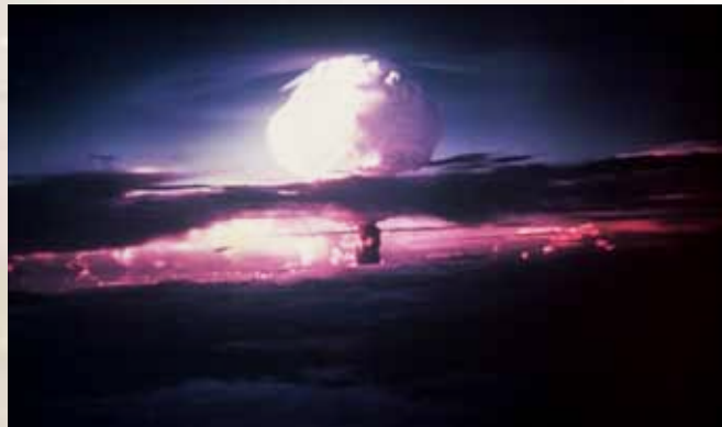
Atombomben over Hiroshima 6. august 1945.

dikteren appellere til følelsene våre mer enn til forstanden, og det er nesten helt nødvendig at ordene kan tolkes på nokså forskjellig måte.