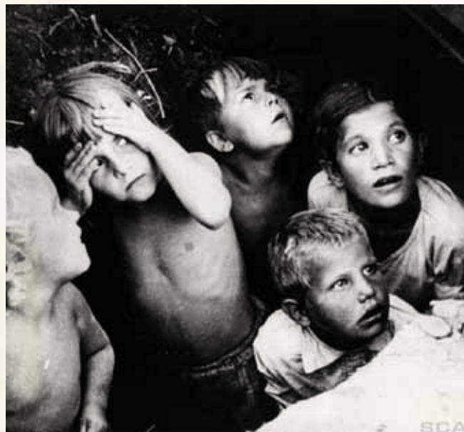
Andre verdenskrig: Skremte barn i frykt gjemmer seg for bomber, granater, flyalarm, skyting.

☞ Det er et knapt språk med korte, enkle setninger. Uttrykket er fortettet, ofte bruker Vesaas bare setningsfragmenter og enkeltstående ord. Det er en minimalistisk form der det enkle og komprimerte er fylt