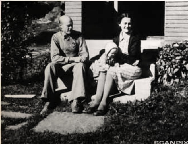
Midtbø, Vinje i Telemark, 1940. På trappa på gården sitter forfatterekteparet Halldis Moren Vesaas og Tarjei Vesaas.

☛ Tarjei Vesaas skrev både romaner, noveller, skuespill og dikt. Han debuterte i 1923 med romanen Menneskebonn . Både i denne boka og i de neste romanene i 1920- og 1930-årene skrev han om mennesket som er bundet til tunge eksistensielle kår.