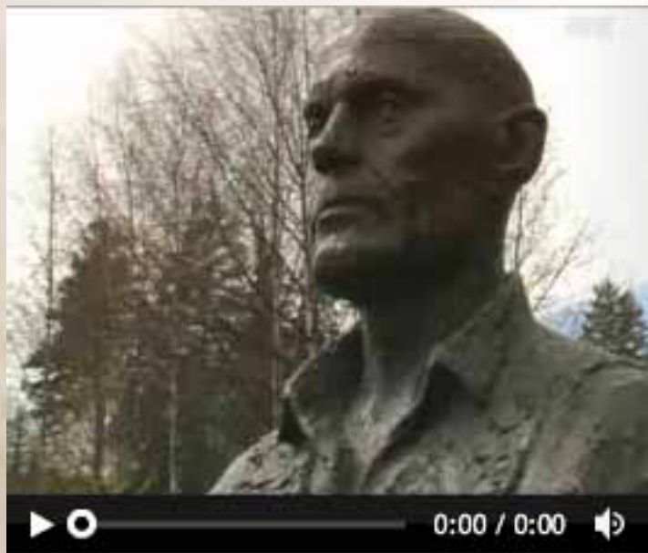
Halldis Moren Vesaas forteller om mannen sin

☞ Vesaas gav ut seks diktsamlinger, som alle er modernistiske i form og uttrykk. Gjennomgangstemaet i diktene hans er angst, ondskap og destruktive krefter. Symbolbruken er rik, og språket er knapt og fortettet, akkurat som i prosadiktningen.