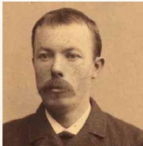
i Europearen Arne Garborg

☞ Garborg såg individuell og nasjonal identitetsbygging som ein gjensidig og kulturell dannelsingsprosess. Her presenterte han moderne tankegods som låg langt føre si tid.