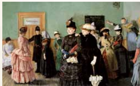
Chr. Krohg: «Albertine i politilægens venteværelse»

☛ Året før Mannfolk kom ut, hadde Christian Krohg gitt ut romanen Albertine , der hovudpersonen er ei fattig jente som endar opp som prostituert. Boka til Krohg vart stoppa og beslaglagd, og Krohg vart dømd for usedeleg verksemd. Mannfolk vart ikkje stoppa, men reaksjonane var kraftige frå både politisk og kulturelt hald, og Garborg miste jobben som statsrevisor året etter på grunn av boka og debattinnlegga sine.