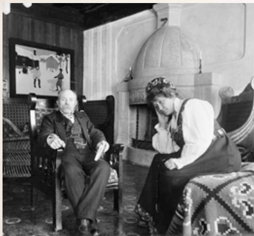
Arne og Hulda Garborg var aktive i samfunns- debatten i 1890-åra

☛ Bakgrunnen for tittelen Kolbotnbrev var at Arne Garborg og kona Hulda i nokre år budde i ei lita stove i Kolbotn i Østerdalen. Garborg var svært produktiv i denne perioden, og Hulda var medprodusent og redaktør. Hulda Garborg (fødd Bergersen) var dessutan eit skrivande menneske, og ho gav mellom anna ut to romanar: Et frit Forhold (1892) og Kvinden skabt af Manden (1904). Hulda Garborg stod for eit radikalt kvinnesyn som nok påverka mannen ho var gift med.