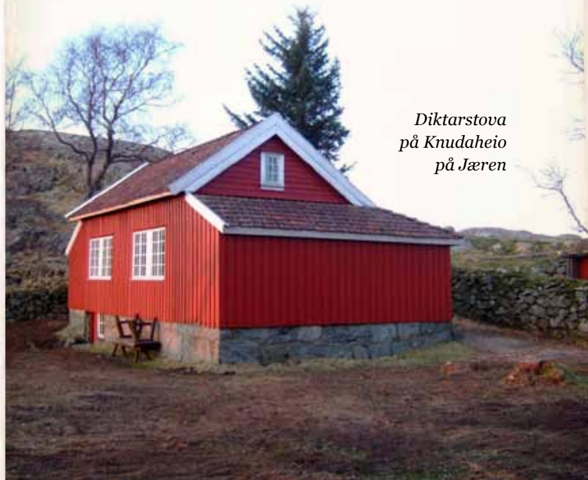
Diktarstova på Knudaheio på Jæren

☛ Frampå 1890-talet flytte ekteparet til Jæren, og Garborg bygde ei diktarstove på Knudaheio. I Knudaheibrev (utgitt i bokform i 1904) utdjuar han tankar om barndomstida og oppveksten, og han set heile livet sitt inn i ein kulturhistorisk samanheng.