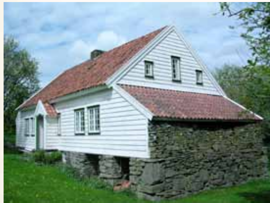
På denne garden på Jæren voks Garborg opp

☛ I 1878 og 1879 skreiv han framhaldsforteljinga Ein Fritenkjar , som vart publisert i Fedraheimen. Her kan vi lese om teologen som ikkje lenger har den rette trua og som orienterer seg bort frå kyrkja. Med denne forteljinga gjekk Garborg rett inn i eit stort stridsemne. Han var heile livet gjennom sterkt kritisk til både kyrkja og pietismen, men etikken hans bygde på kristne grunnverdiar.