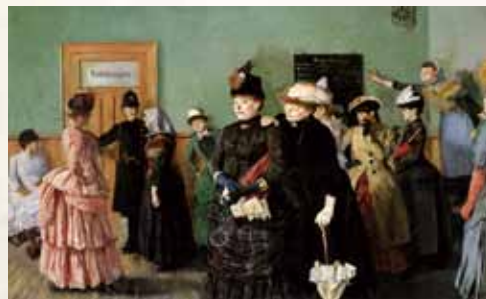
Chr. Krohg: «Albertine i politilægens venteværelse»

☛ Året før Mannfolk kom ut, hadde Christian Krohg gitt ut romanen Albertine , der hovedpersonen er ei fattig jente som ender opp som prostituert. Boka til Krohg ble stoppet og beslaglagt, og Krohg ble dømt for usedelig virksomhet. Mannfolk ble ikke stoppet, men reaksjonene var kraftige fra både politisk og kulturelt hold, og Garborg mistet jobben som statsrevisor året etter på grunn av boka og debattinnleggene sine.