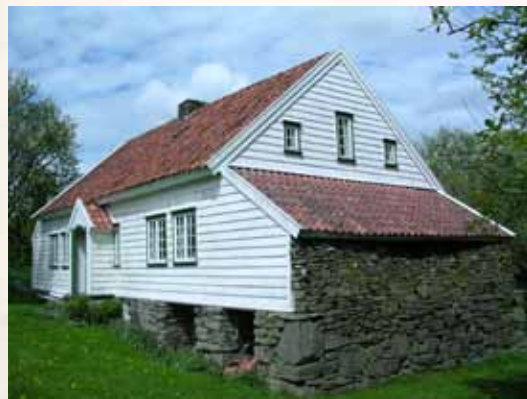
På denne gården på Jæren vokste Garborg opp

☛ I 1878 og 1879 skrev han fortsettelsesfortellingen Ein Fritenkjar , som ble publisert i Fedraheimen. Her kan vi lese om teologen som ikke lenger har den rette troen, og som orienterer seg bort fra det kirkelige. Med denne fortellingen gikk Garborg rett inn i et stort stridsemne. Han var hele livet gjennom sterkt kritisk til både kirken og pietismen, men etikken hans bygde på kristne grunnverdier.