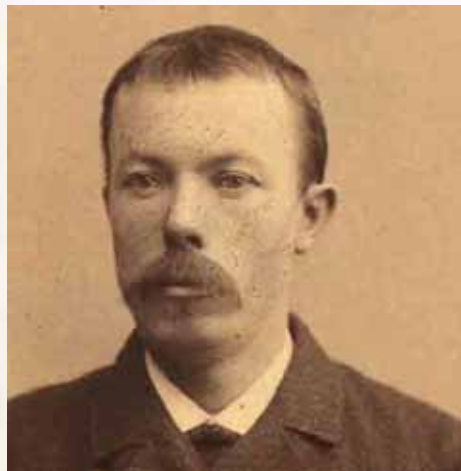
i Europeeren Arne Garborg

☞ Garborg så individuell og nasjonal identitetsbygging som en gjensidig og kulturell dannelsesprosess. Her presenterte han moderne tankegods som lå langt forut for sin tid.