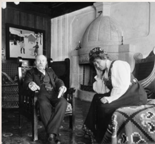
Arne og Hulda Garborg var aktive i samfunns- debatten i 1890-årene

☛ Bakgrunnen for tittelen Kolbotnbrev var at Arne Garborg og kona Hulda i noen år bodde i ei lita stue i Kolbotn i Østerdalen. Garborg var svært produktiv i denne perioden, og Hulda var medprodusent og redaktør. Hulda Garborg (født Bergersen) var dessuten et skrivende menneske, og hun gav blant annet ut to romaner: Et frit Forhold (1892) og Kvinden skabt af Manden (1904). Hulda Garborg stod for et radikalt kvinnesyn som nok påvirket mannen hun var gift med.