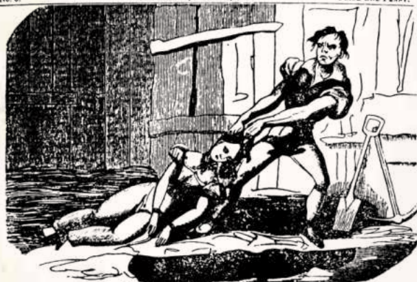
Corder burying the Body of Maria Martin.