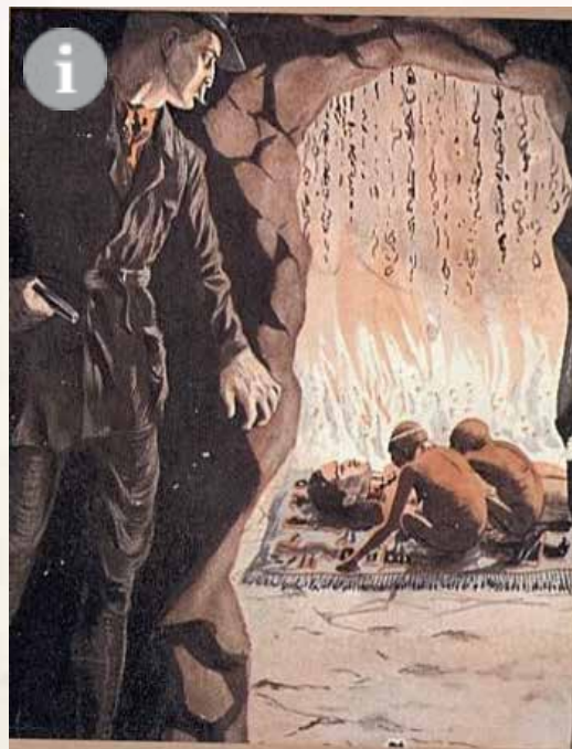
Omslagsbiletet til De udødelige dverge ; Lille Jonas Fjeld; Storfjellens herre Øvre Richter Frich utgitt av Norild

krigsåra var ikkje menneskesynet til Richter Frich noko ekstremt eller spesielt. Det var samtidas syn på framande folk og kulturar som kom til uttrykk i populærlitteraturen frå denne tida, og det gjaldt ikkje minst den populærlitteraturen som vart utgitt under nemninga kristen litteratur .