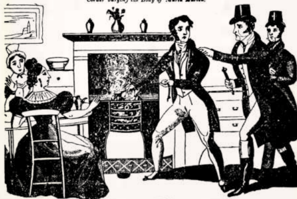
The Arrest of Corder.