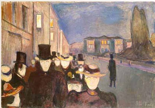
«Aften på Karl Johan» av Edvard Munch (1892)

☞ I den prosalyriske teksten «Byen» møter vi ein eg-person som ikkje finn ro der han er. Han bur på fjellet og har ikkje sett noko menneske på mange veker. Livet hans er prega av absolutt ro og einsemd, han høyrer ikkje anna enn sine egne tankar og bølgeskvulpet i tjer-net. Med eitt kjenner han angst og eit sagn