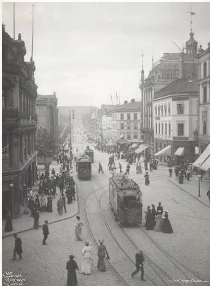
Folkeliv på Karl Johan i 1902

☛ I «Byen» finn vi òg ein kontrast mellom livet på fjellet og livet i byen, i alle fall på overflata. Eg-personen i teksten opplever slett ikkje det guddommelege nærværet i naturen som dei romantiske diktarane elska å skildre, tvert imot. Fjellet har ikkje noko hjarte og maner fram angst hos eg-personen. Derfor set han sin lit til at byen kan vere staden han kjenner seg heime i. Men også byen skaper berre angst og framandgjerung. Eg-personen blir heimlaus og einsam overalt i verda, han finn ikkje ro nokon stad.