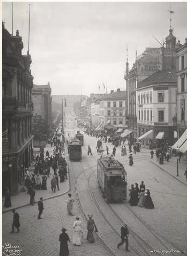
Folkeliv på Karl Johan i 1902

☛ I «Byen» finner vi også en kontrast mellom livet på fjellet og livet i byen, i alle fall på overflata. Jeg-personen i teksten opplever slett ikke det guddommelige nærværet i naturen som de romantiske dikterne elsket å skildre, tvert imot. Fjellet har ikke noe hjerte og maner fram angst hos jeg-personen. Derfor setter han sin lit til at byen kan være stedet han føler seg hjemme i. Men også byen skaper bare angst og fremmedgjøring. Jeg-personen blir hjemløs og ensom overalt i verden, han finner ikke ro noe sted.