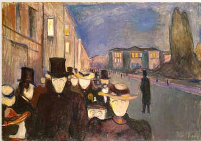
«Aften på Karl Johan» av Edvard Munch (1892)

☞ I den prosalyriske teksten «Byen» møter vi en jeg-person som ikke finner ro der han er. Han bor på fjellet og har ikke sett noe menneske på mange uker. Livet hans er preget av absolutt stillhet og ensomhet, han hører ikke annet enn sine egne tanker og bølgeskvulpet i tjer-net. Plutselig kjenner han angst og et savn