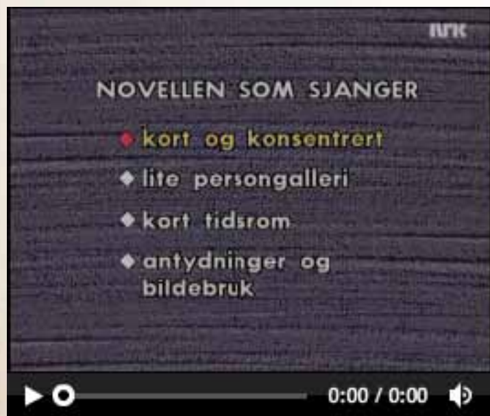
Ein analyse av novella «Karen»

kvitte seg med gamle fordommar, tenkje nytt og utvikle samfunnet vidare til alles beste, men tek det ille opp når han like etter blir korrigert av sonen i ein diskusjon. Denne dobbelkommunikasjonen viser avstanden mellom dei overflatiske liberalistiske talemåtane og dei djuptliggande konservative haldningane hos borgarskapet på Kiellands tid.