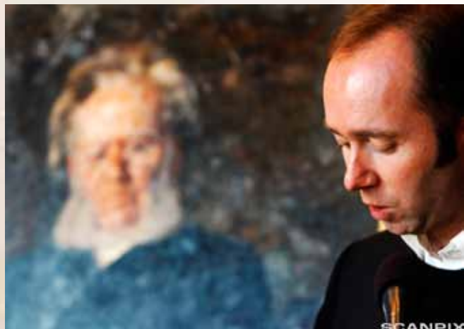
Tidligare kultur- og kyrkjeminister Trond Giske ved eit portrett av Henrik Ibsen.

☞ Nest etter Shakespeare er Henrik Ibsen den mest spela dramatikaren i verda. Nora, Hedda, Peer Gynt og Hedvig blir tolka av kinesiske, brasilianske, russiske og indiske skodespelarar, for å nemne nokon. Men kvifor alt engasjementet rundt Ibsen? Kva er det som gjer at han framleis er så aktuell?