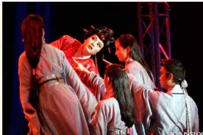
Hangzhou Yue Opera framførte sin versjon av Hedda Gabler under åpninga av Ibsen-året 2006.

ho seg med at ho har gjort det for å sikre han stillinga på universitetet.