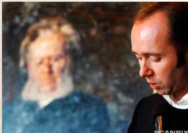
Tidligere kultur- og kirkeminister Trond Giske ved et portrett av Henrik Ibsen.

☞ Nest etter Shakespeare er Henrik Ibsen den mest spilte dramatikeren i verden. Nora, Hedda, Peer Gynt og Hedvig blir tolket av kinesiske, brasilianske, russiske og indiske skuespillere, for å nevne noen. Men hvorfor alt engasjementet rundt Ibsen? Hva er det som gjør at han fortsatt er så aktuell?