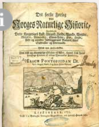
Tittelbladet på Det første Forsøg paa Norges naturlige Historie av Erik Pontoppidan

I same perioden kjem det ut fleire opplysningsbøker, mellom anna reiseskildringar og bøker om språk, geografi og historie. Den danskfødde bergensbiskopen Erik Pontoppidan gir ut ei norsk ord-