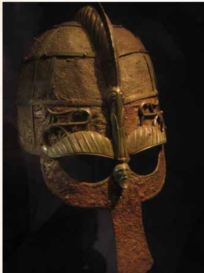
Prakthjelm i jern og bronse funnet i en svensk båtgrav fra den tida da Beowulf levde

☞ Helten Beowulf er preget av en sterk skjebnetro. Han er overbevist om at det er skjebnen som bestemmer når han skal dø. Denne skjebnetroen er dypt forankret i germansk krigstradisjon. Vi finner den samme troen også i de norrøne helte-diktene og i islendingesagaene.