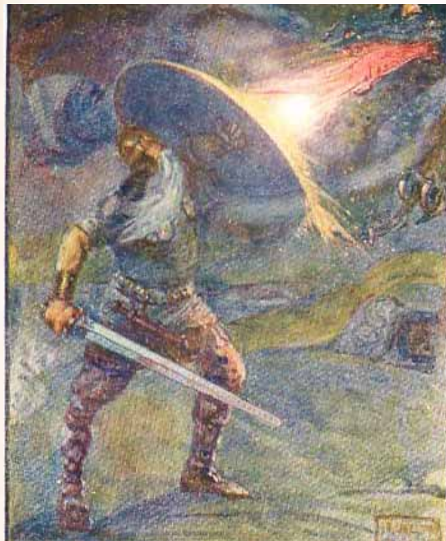
Beowulf i kamp med draken. Til høyre gravhaugen i Skalunda i Götaland der Beowulf skal være hauglagt

Götaland i Sør-Sverige). Siste del av kvadet skildrer hvordan han drar ut sammen med mennene sine for å drepe en drake som ødelegger landet hans. Men det er bare én av mennene som tør å møte dra-