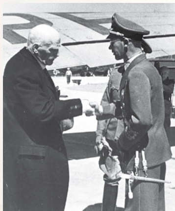
Knut Hamsun blir motteken på Fornebu av rikskommissær Josef Terboven i 1943.

☛ Da nazistane kom til makta i Tyskland i 1933, var Hamsun alt ein gammal mann på over sytti år. Samfunnssynet og verdiane hans samsvara mykje med ideane til nazistane. Han støtta Tyskland offentleg, også etter at tyskarane hadde invadert Noreg i 1940. Etter Hitlers sjølv mord i 1945 skreiv han jamvel ein rosande nekrolog om diktatoren.