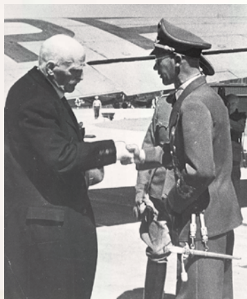
Knut Hamsun blir mottatt på Fornebu av rikskommisær Josef Terboven i 1943.

☛ Da nazistene kom til makta i Tyskland i 1933, var Hamsun allerede en gammel mann på over sytti år. Samfunnsynet og verdiene hans samsvarte for en stor del med nazistenes ideer. Han støttet Tyskland offentlig, også etter at tyskerne hadde invadert Norge i 1940. Etter Hitlers selvmord i 1945 skrev han til og med en rosende nekrolog om diktatoren.