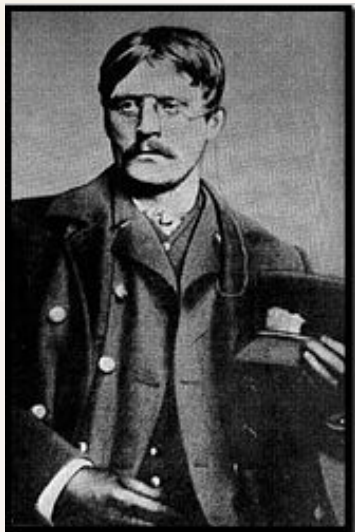
Hamsun som sporvognskonduktør i Chicago under det første opphaldet sitt i USA i 1884.

USA var ødelagt av kapitalismen, mente han. Det var pengene som styrte, ikke folket. I 1889 gav han ut Fra det moderne Amerikas Aandsliv , en samling tekster der han nettopp kritiserte amerikanernes levemåte, politikk og verdier. I boka avslører han også sterke sympatier for anarkistiske tanker.