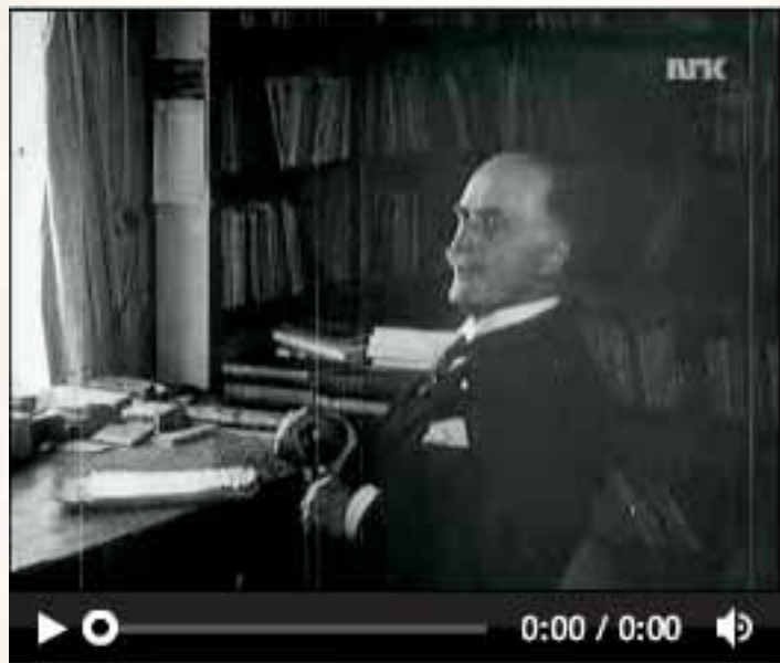
Knut Hamsun 85 år (Filmavisen). Glimt fra gården Nørholm ved Grimstad og fra den tyske okkupasjonsmaktas feiring av dikterhøvingen.