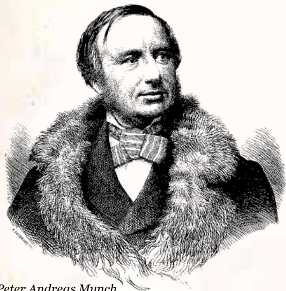
Peter Andreas Munch

☞ Ein av dei få på denne tida som har omfattande kunnskap om språk, er professor Peter Andreas Munch. I 1832 skriv han artikkelen «Norsk Sprog-reformation», der han går imot ideen om