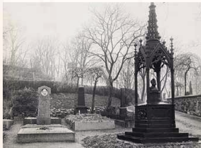
«Taknemmelige jøder udenfor Norriges grændser reiste ham dette minde,» står det på monumentet som svenske og danske jødar fekk reist på Wergelands gravstad på Vår Frelsers gravlund i Christiania (Oslo) i 1849.

kjem til uttrykk i teksten. Diktet har verken enderim eller fast strofeform. Ein klassisist som Welhaven ville ha sagt at forma har ein eigenverdi, at kjenslene må dempast og innhaldet foredlast slik at orda passar inn i ei streng, regelbunden form. For Wergeland har forma ein annan funksjon. Ho skal stø opp under det dikta-ren vil formidle.