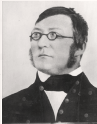
Daguerreotypi av Henrik Wergeland. Systema hans, Camilla Collett, meinte det var det einaste biletet av han som verkeleg likna.

☞ Henrik Wergeland er både romantikar og fornuftsdyrkar på same tid. Begeistringa hans for naturen, fantasiflukta og