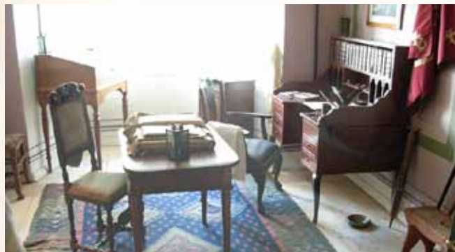
Som riksarkivar hadde Wergeland dette kontoret på Akershus festning.

☞ Med stilling i embetsverket og diktargasje har Wergeland råd til å bygge diktarbustaden Grotten i 1841. Men i 1844